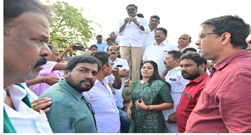
ఆయన మాట్లాడుతూ తెలంగాణ ప్రభుత్వంలో ఖమ్మం మిర్చి మార్కెట్ లో రికార్డు స్థాయిలో ధర పలికింది అని పేర్కొన్నారు.కొన్ని క్వింటాలే కాదు...రైతులు పండించిన ప్రతి బస్తాలను కొనుగోలు చేస్తామని ఎవరు ఆందోళన చెందాల్సిన పని లేదని తెలంగాణ ప్రభుత్వం వచ్చాక వ్యవసాయం లాభసాటిగా మారిందని, మనం పండించే